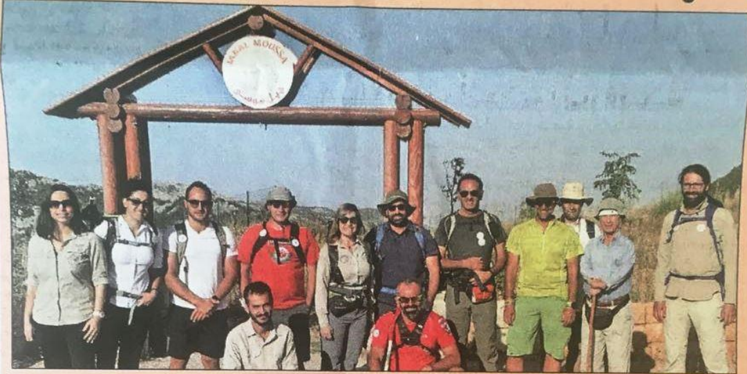
مشاركون في افتتاح المحمية

العالمية، وذلك بهمة الداعمين والمؤمنين بقضية الجمعية وبأهدافها. ولفت الى أن هدف الجمعية الأهم هو الإنماء المحلي المستدام، كاشفاً أن «الحركة الاقتصادية المستدامة تزداد يوماً بعد يوم في المنطقة وتجعل من جبل موسى محمية حامية لتقاليدنا وتراثنا ولهويتنا وجذورنا».