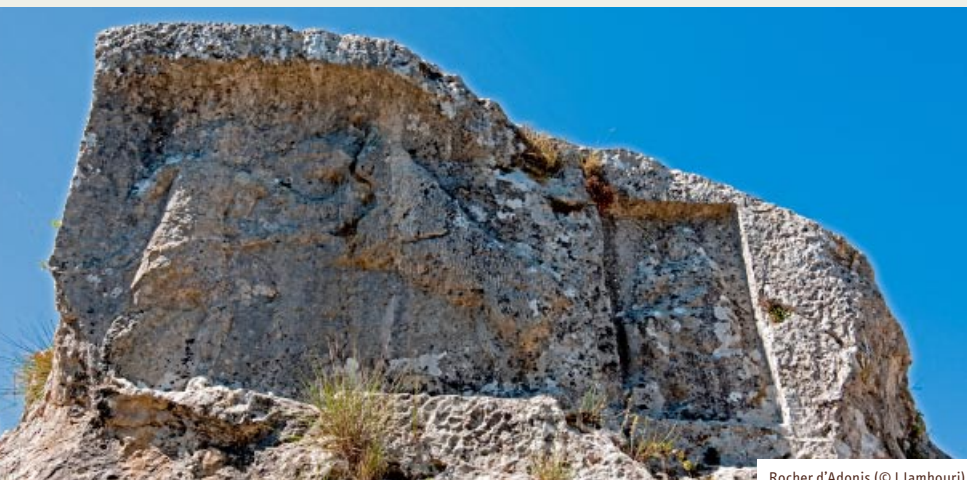
Rocher d'Adonis